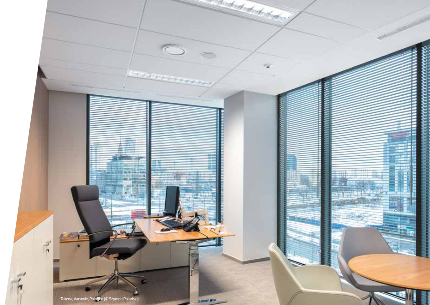
Takeda, Varsovie, Pologne

Un plafond de grande qualité doit pouvoir résister à tout ce que la vie lui réserve. Durabilité, fiabilité, qualité. Ce sont ces caractéristiques qui font d'ADAGIO un élément essentiel d'un grand espace, qui reste propre, élégant, intact, lumineux et blanc plus longtemps. Tout cela pour améliorer l'aspect à long terme de votre plafond. Pour créer des environnements qui améliorent la vie d'une manière à la fois pratique et émotionnelle. Et pour créer des espaces capables de faire face aux exigences du quotidien et de résister à l'épreuve du temps.