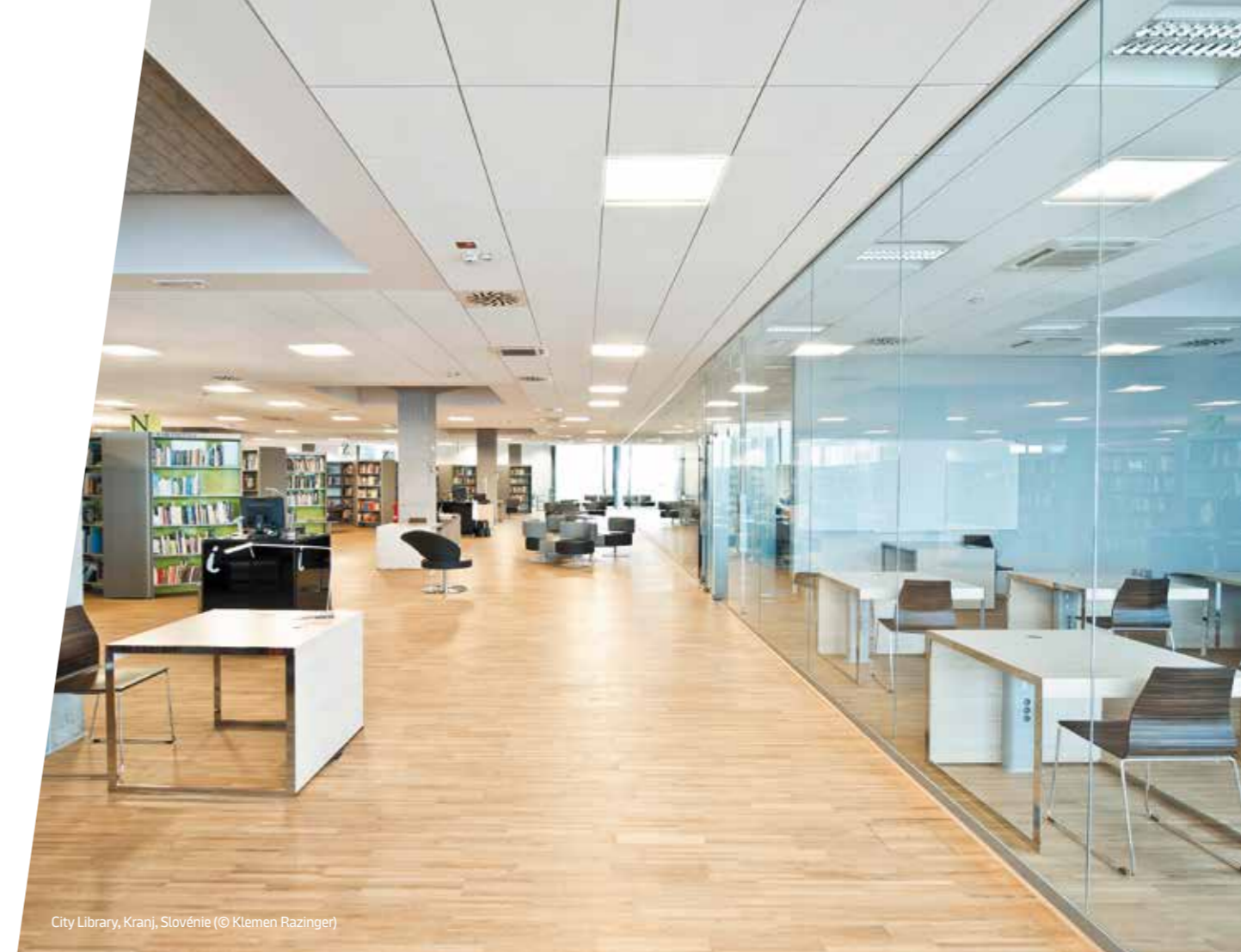
City Library, Kranj, Slovénie