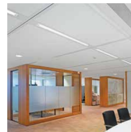
Van Oord Headquarters, Rotterdam, Pays-Bas

Que ce soit avec ossature cachée ou apparente, ADAGIO s'adapte à n'importe quelle vision du design.