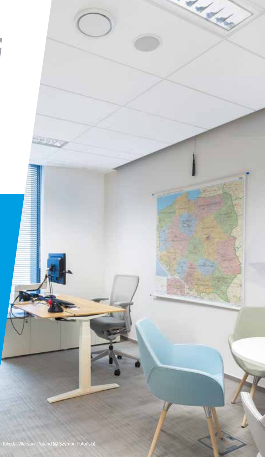
Takeda, Warsaw, Poland